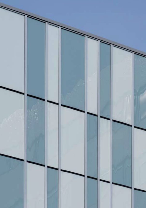
CHU Bordeaux, Pessac - Architectes : Gonfrville Lafourcade Roquette